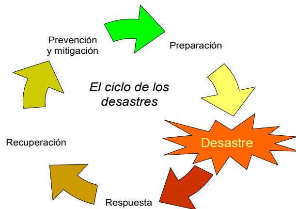
Figura 1 El ciclo de los desastres

14. Las actividades de prevención y mitigación tienen por fin minimizar los riesgos que entraña cualquier peligro. Ello se logra, reduciendo la exposición a los peligros y la vulnerabilidad así como adoptando medidas para evitar peligros o que aumente su frecuencia o gravedad.